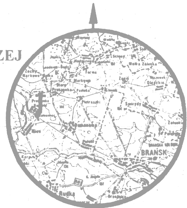
SZKIC ORIENTACJI skala 1:250,000

WYKONAWCA: USŁUGI GEODEZYJNO-KARTOGRAFICZNE inż. MAREK ANTONI LUKASZEWICZ